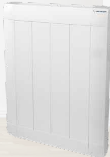
FINE DOMO Para instalaciones con centralita o centralita y racionalizador