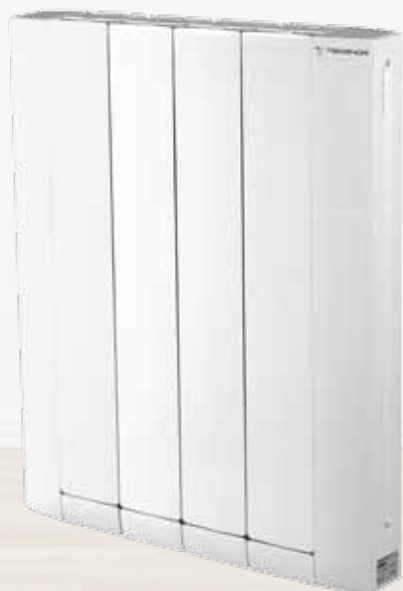
STYLE DOMO Para instalaciones con centralita o centralita y racionalizador