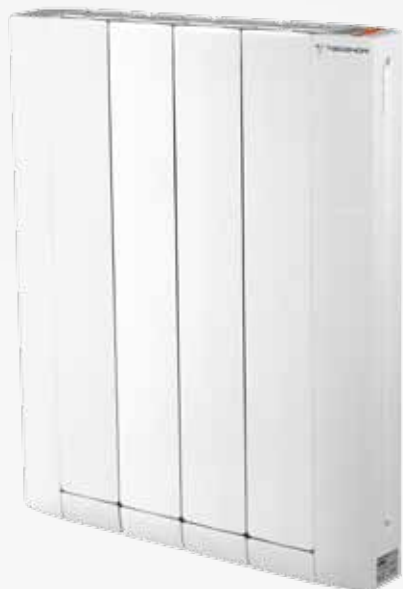
STYLE- D TB (Termostato digital) STYLE-C TB (Cronotermostato) Para instalaciones con racionalizador