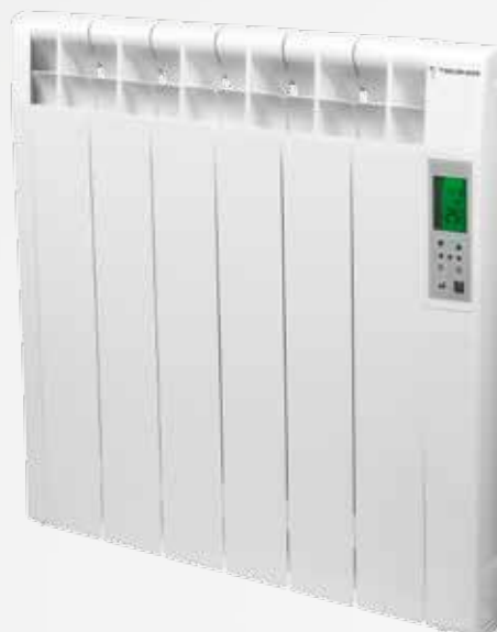
ONE- D TB (Termostato digital) ONE-C TB (Cronotermostato) Para instalaciones con racionalizador