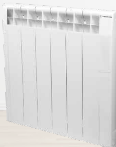
ONE DOMO Para instalaciones con centralita o centralita y racionalizador