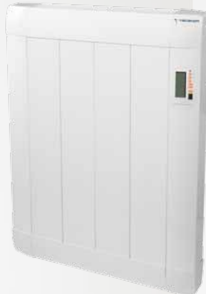
FINE- D TB (Termostato digital) FINE-C TB (Cronotermostato) Para instalaciones con racionalizador