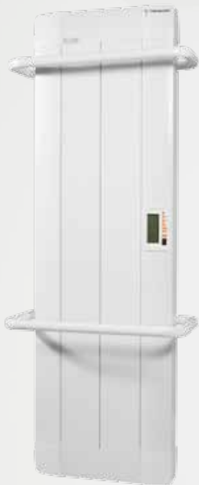
RST- D TB (Termostato digital) RST-C TB (Cronotermostato) Para instalaciones con racionalizador