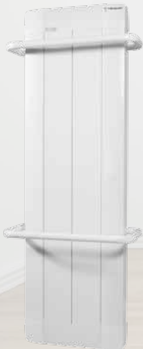
RST DOMO Para instalaciones con centralita o centralita y racionalizador